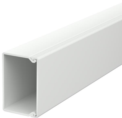
Kanaloberteil und -unterteil mit Bodenlochung.