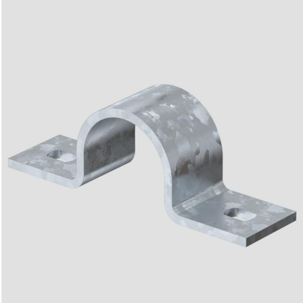
Befestigungsschelle zweilappig 32mm