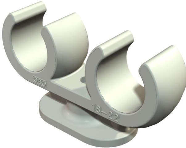
Sockel-Klemmschelle 2 Kabel 10mm