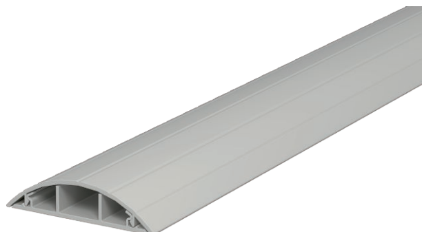
Kanaloberteil und -unterteil mit Bodenlochung.